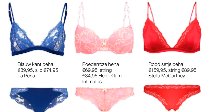
Blauw kant beha €89,95, slip €74,95 La Perla