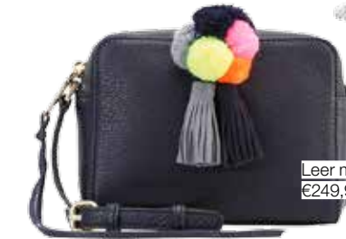
Leer met pomponnetjes €249,95 Rebecca Minkoff