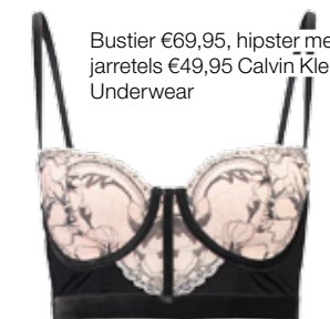
Bustier €69,95, hipster met jarretels €49,95 Calvin Klein Underwear