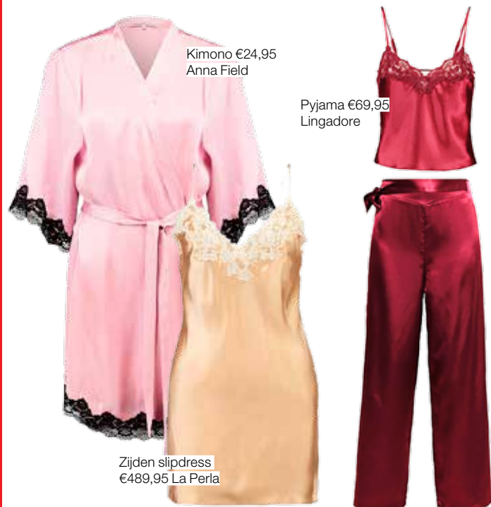
Kimono €24,95 Anna Field