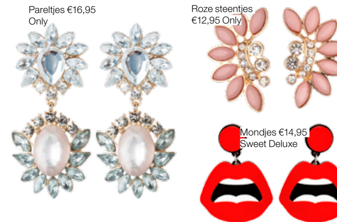
Pareltjes €16,95 Only