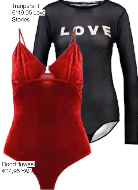
Tranparant €119,95 Love Stories