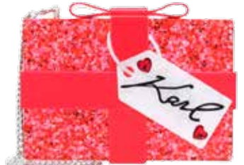
Clutch €154,95 Karl Lagerfeld