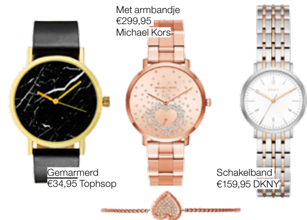
Met armbandje €299,95 Michael Kors