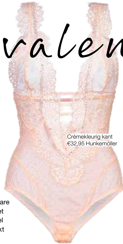
Crèmekleurig kant €32,95 Hunkemöller

(BEELDREDACTEUR) Ik hou van body's, mooi met flare jeans of een rokje. Ik draag niet veel sieraden, maar een subtiel kettinkje of een ring erbij maakt het af.