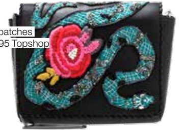
Met patches €54,95 Topshop

(CHEF VORMGEVING) Ik kan geen genoeg krijgen van tassen. Voor iedere outfit én gelegenheid heb ik er een.